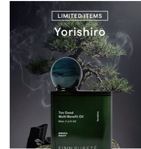
LIMITED ITEMS Yorishiro

フィグにブラックティーとローズの陰影。ペチパーとムスクが溶け合い、静かに広がる。余白と色香を纏うウッディフローラル。