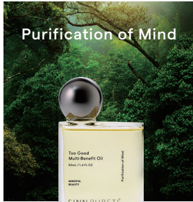
Purification of Mind