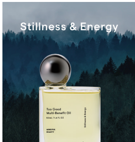
Stillness & Energy

カルダモンの立ち上がりに、金木犀とイランイランの柔らかな残香。インセンスとウッドが重なり、心を静かに預けるスモーキーフローラル。