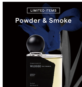
LIMITED ITEMS Powder & Smoke

ローズとゼラニウムの華やかさに、マジョラムとラベンダーの落ち着き。感情を穏やかに高め、静かに幸福感で満たすフローラルハーバル。