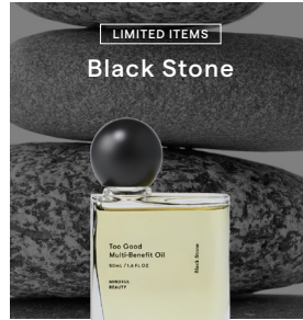
LIMITED ITEMS Black Stone

ユーカリとラベンダーの静けさに、シダーウッドとパチョリが深さを与える。森の中にいるように、思考をリセットするハーバルウッディ。